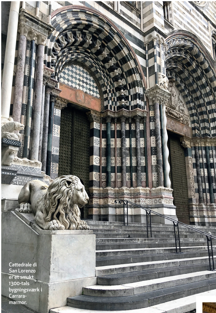
Cattedrale di San Lorenzo er et smukt 1300-tals bygningsværk i Carrara-marmor.