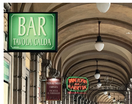
Ved Porto Antico ligger restauranter og caféer side om side i de gamle arkader.

Er turen på budget, så prøv Airbnb i bydelen Castelletto, med førsteklasses udsigt.